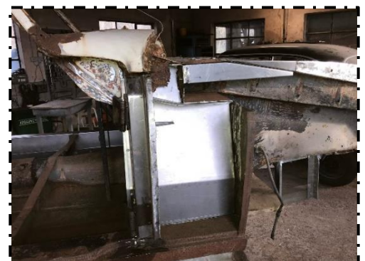
Venstre side tilpasset