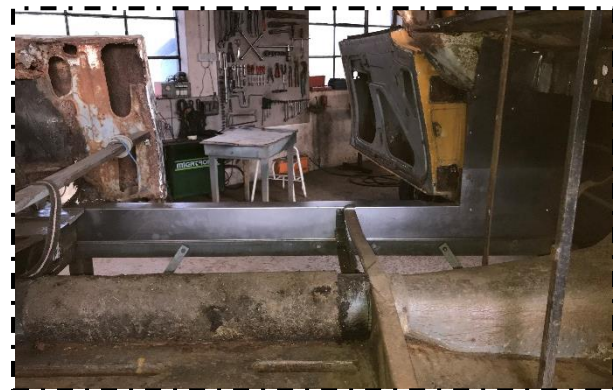
Indvendigt panel; venstre side