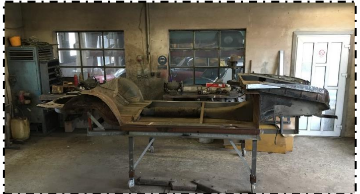
Bundplatform; Isabella personbil

Det er godt nok noget af et puslespil, med brikkerne spredt over det meste af Europa. Bilen er importeret fra Grækenland til Tyskland; derefter hentede vi den i Steinfurt tæt ved Münster og kørte den til Danmark på 611'eren.