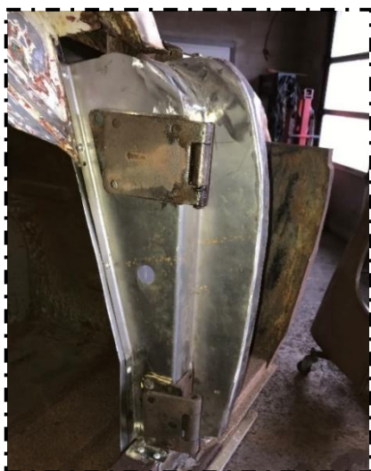
Dørstolpe; eget fabrikat