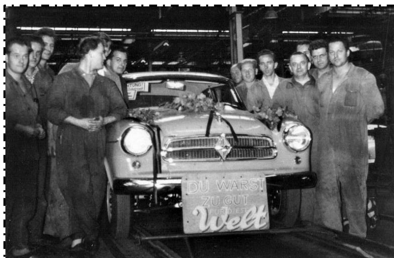
Den sidste Isabella ruller af produktionsbåndet: "Du warst zu gut für diese Welt"

Som bekendt blev Borgward grundlagt i Bremen, Tyskland i 1890 med produktion af Borgward-, Hansa-, Goliath- og Lloyd-mærkerne og blev Tysklands tredjestørste bilproducent. Den første æra sluttede i 1961, da Borgward blev tvunget i likvidation for første gang.