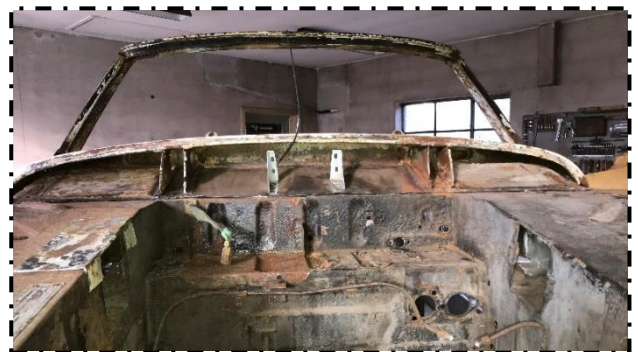
Frontruderamme; tilpasset bund